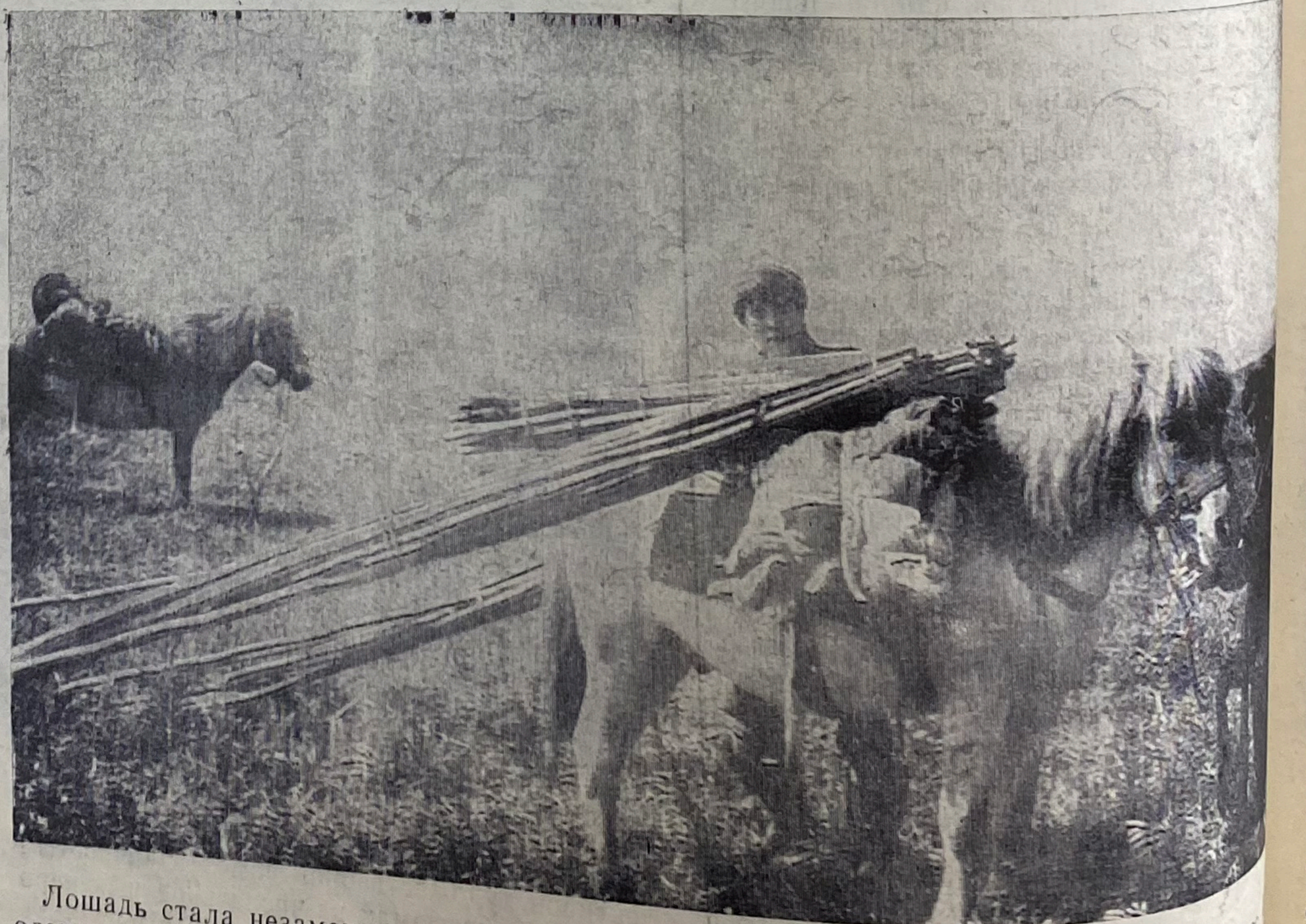
Лошадь стала незаменимым помощником оленевода во время кочевий. Оленьи шкуры, жерди для чума, домашняя утварь, посуда,

продукты имеют довольно большой вес, ревозить все это на десятки километров на лошадях.