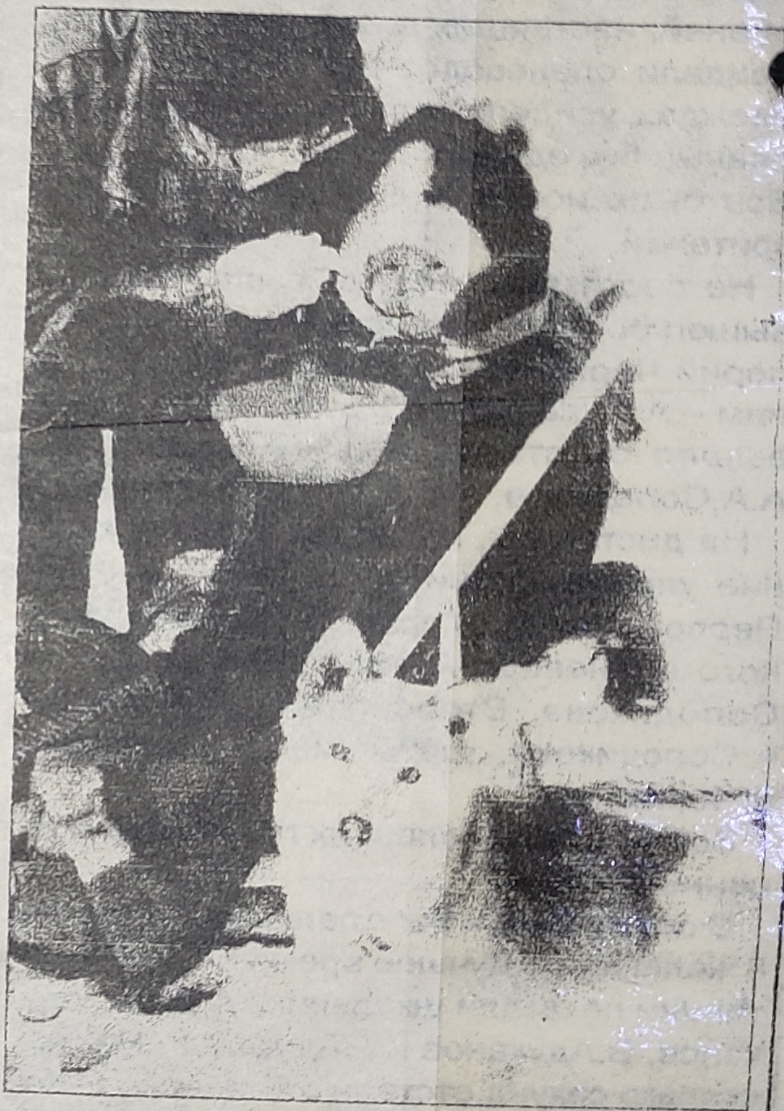
г. Салехард. 12-13 марта 2002г.